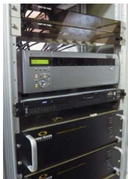
録画された映像は大容量のハードディスクレコーダーに保存

撮影された映像は、都内のデータセンターにてネットワークディスクレコーダー DG-ND400 に 24 時間記録され、一定期間保存されます。映像は本人だとはっきり分かるほど高精彩に記録されているためプライバシーの保護には細心の注意が必要です。映像データは警察から要請があった場合のみ提供され、厳格なルールのもと再生の際には必ずカメラシステム管理メンバーが立会います。