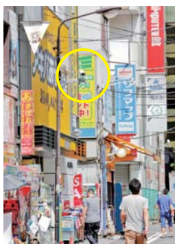
煩わしい配線がないため、街灯への設置も容易です

中央通沿いを中心に、メガピクセルネットワークカメラ DG-NP 304 が 34 台設置されています。カメラを無線ネットワークでつなぐことで、電柱のないスッキリとした街の景観も守っています。また、無線での通信が不安定になり、途切れた場合でもカメラに搭載された SD メモリーカードによる自己バックアップ機能により、HD へ録画できない瞬間もカメラ本体で記録。万一の備えも安心です。