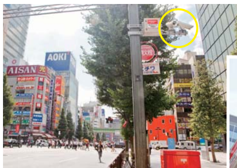
中央通りの交差点付近にも設置