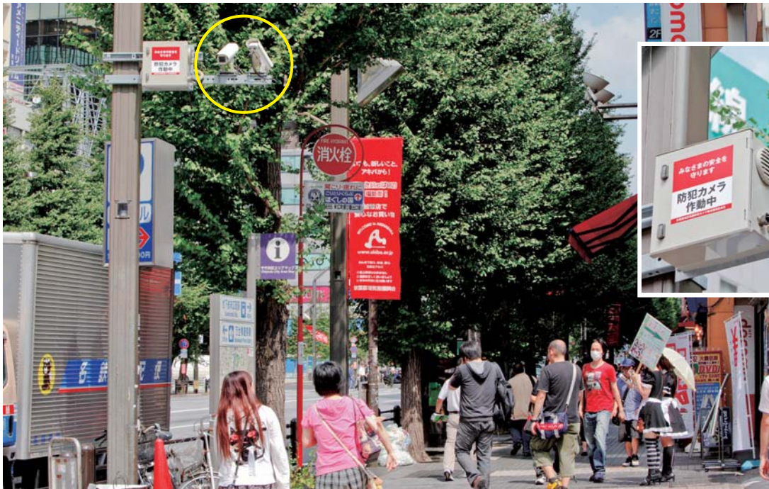
メガピクセルネットワークカメラ DG-NP304